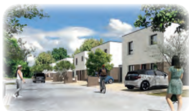
HOUSSEM 9 pavillons