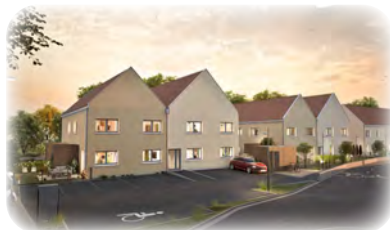
TURCKHEIM 13 appartements