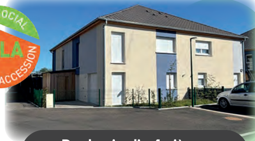
Duplex-jardin 4 pièces à partir de 257 404 €

Disponibilité immédiate en clé en main CONTACTEZ-NOUS !