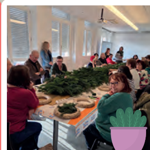
Couronne de l'Avent