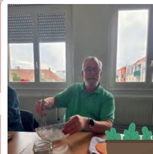
Atelier zéro déchet