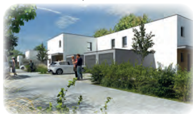
MARCKOLSHEIM 9 pavillons